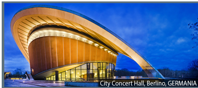
City Concert Hall, Berlino, GERMANIA